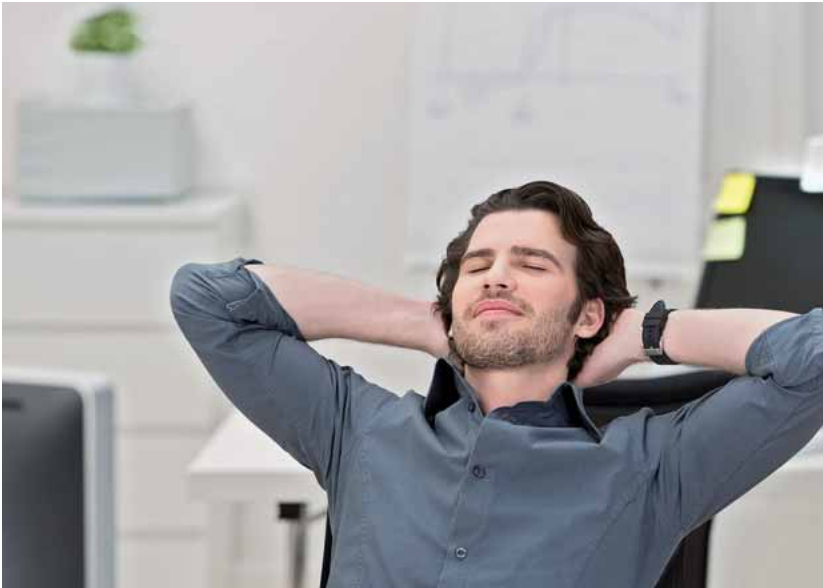
Die Hälfte der Führungskräfte und Mitarbeiter verdient heute doppelt so viel wie früher, aber muss dreimal so viel dafür arbeiten.

SEI WERT Da ich oft Vorträge vor internationalem Publikum halte, verwende ich gerne englische Begriffe. Ich spreche von Time-Management und von Life-Leadership. Das ist noch umfassender als Selbstmanagement oder Selbstführung. Time-