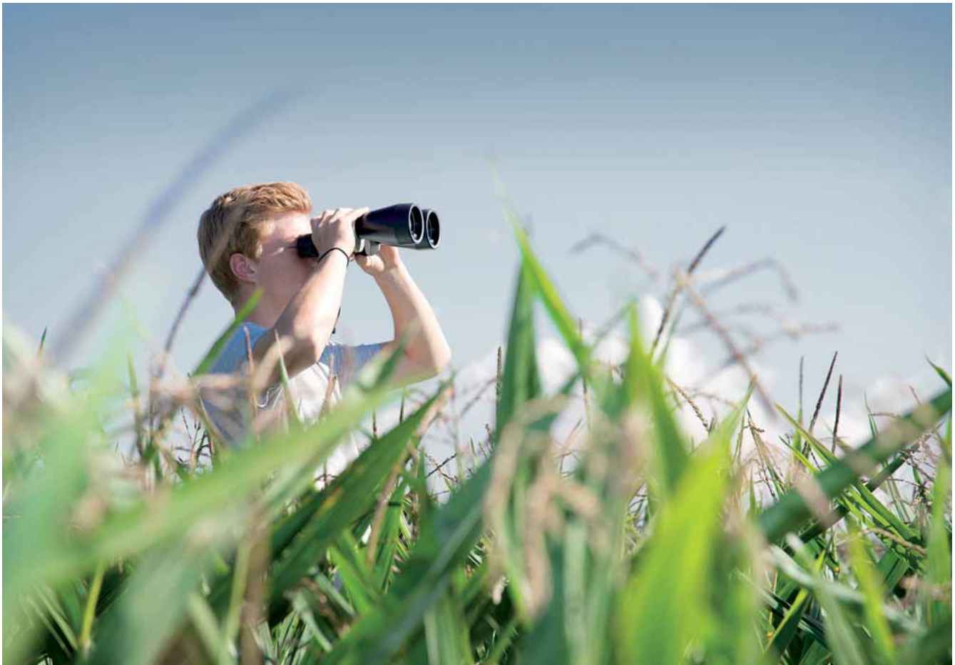
Umfangreiche Aufgaben lassen sich am besten in Teilschritten erledigen.

geben und den Topf ganz langsam erwärmen, dann reagiert der Frosch nicht und stirbt schließlich. So komme ich mir manchmal in unserer Gesellschaft vor: Wir merken gar nicht, wie wir immer mehr reglementiert werden – bis es zu spät ist. Was einmal unter Ludwig Erhard so vielversprechend als soziale Marktwirtschaft begann, erfüllt längst die Kriterien einer sozialistischen Planwirtschaft.