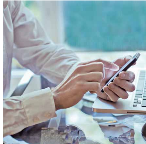
Die Grenze zwischen sogenannter Arbeit und Freizeit verflüchtigt sich.

tionierende Prozesse eingreift, stört. Natürlich müssen wir den Straßenverkehr regeln, natürlich muss ein Schiedsrichter auf dem Fußballfeld pfeifen, aber das reicht auch schon. Viele Dinge müssen wir – typisch deutsch – eben nicht auch noch regulieren.